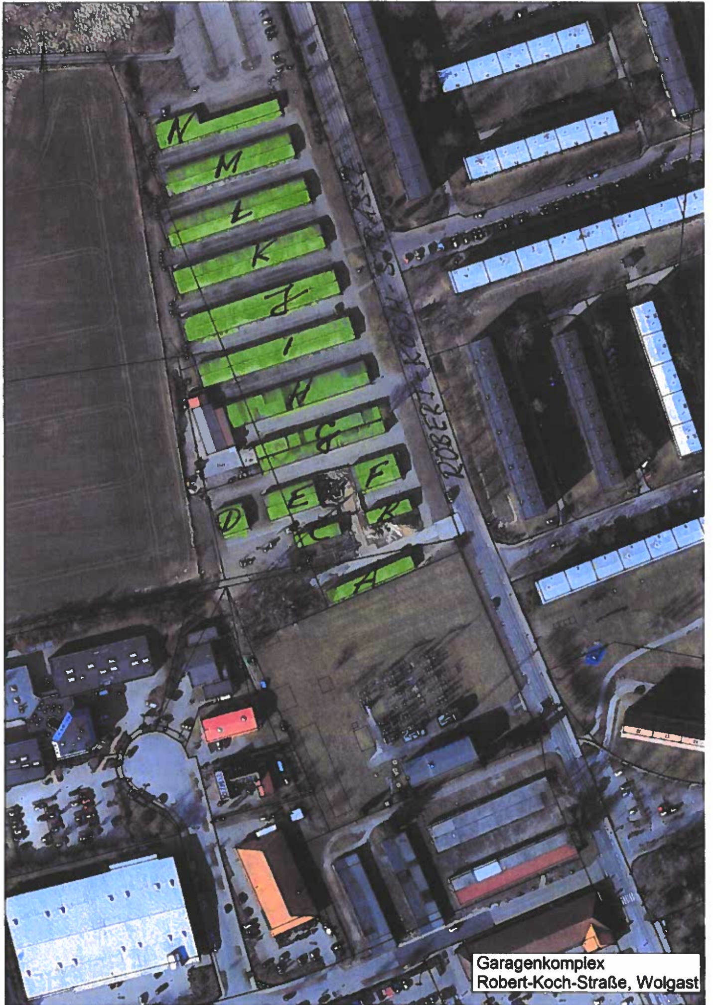
Garagenkomplex Robert-Koch-Straße, Wolgast